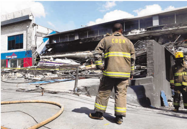
El cuerpo de bomberos del DN realizando los trabajos de levantamiento.

Un miembro del cuerpo de bomberos había sido afectado por un choque de humo, pero fue asistido en el lugar y esta fuera de peligro